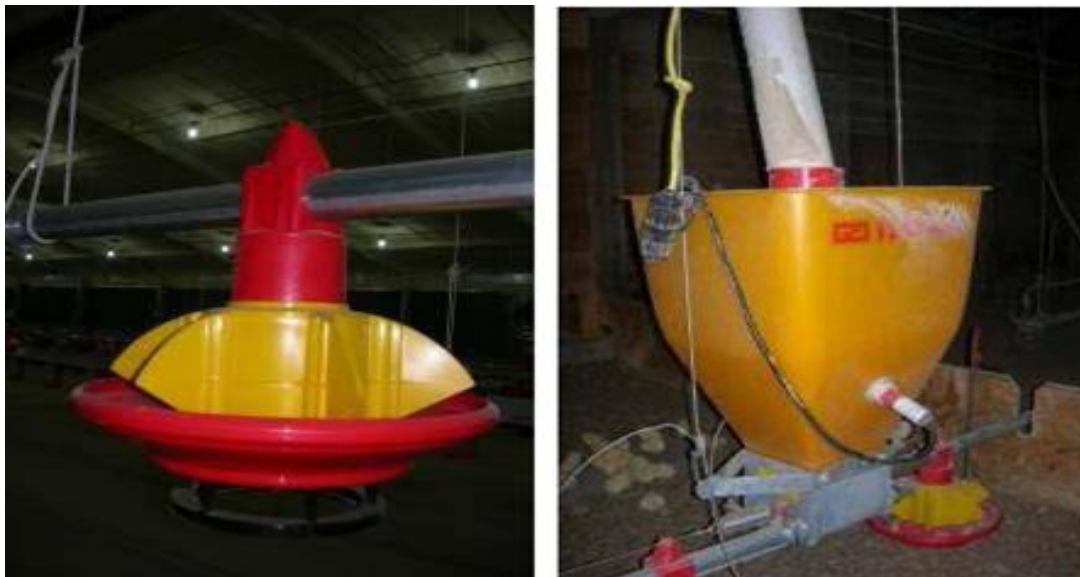
Εικόνα 4 Φωτογραφία Τροφοδοχείου ταϊστρας