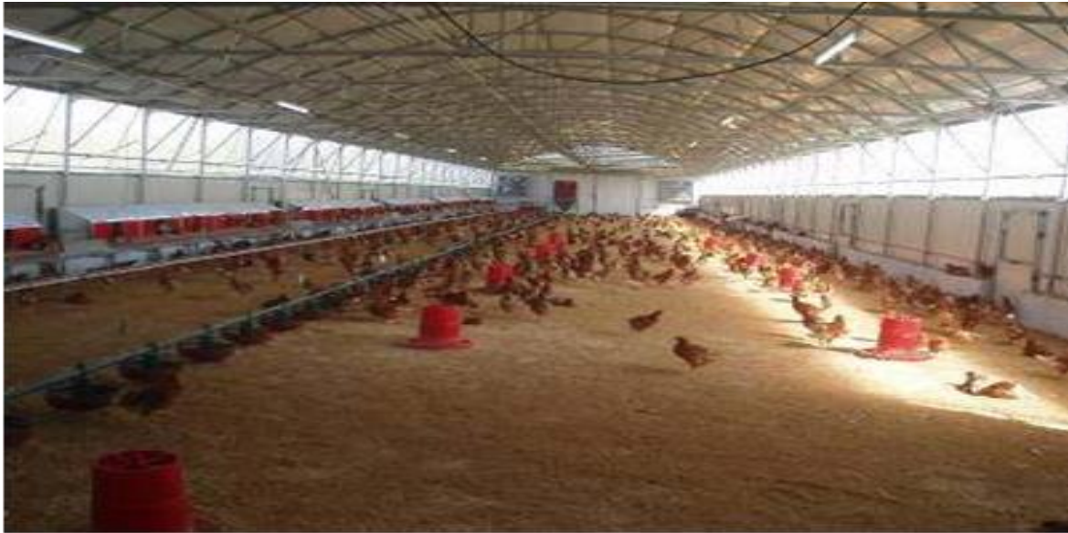
Εικόνα 1 Πτηνοτροφείο τύπου toll