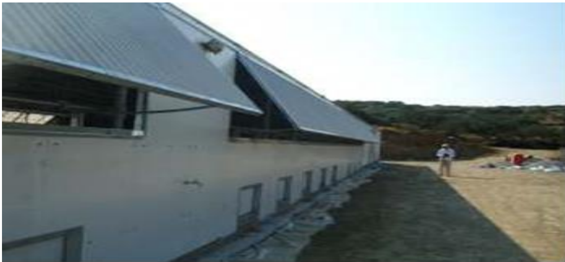
Εικόνα 2 Αερισμός Πτηνοτροφείου

Ο αερισμός στο πτηνοτροφείο πραγματοποιείται με τη δημιουργία δύο (2) πλαϊνών παραθύρων (Εικόνα 2) σε όλο το μήκος κάθε πλευράς πλάτους 1,25m και συνολικού μήκους 42m, με κάλυψη από πλαστικό πολυεστέρα (fiberglass) ανοιγόμενα χειροκίνητα με δυνατότητα ηλεκτροκίνησης.